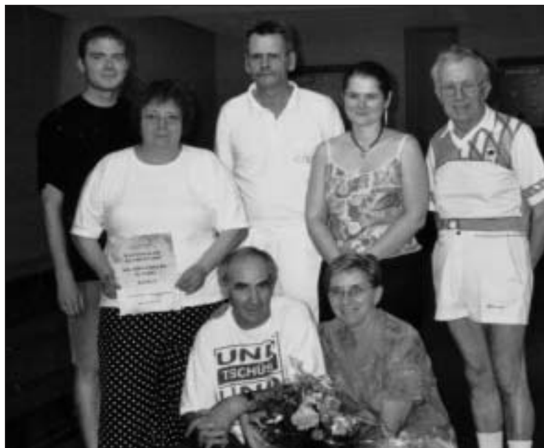
Die Finalisten: KK Abeggbuëbe