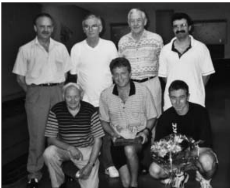
Die Sieger: KK Oberberg