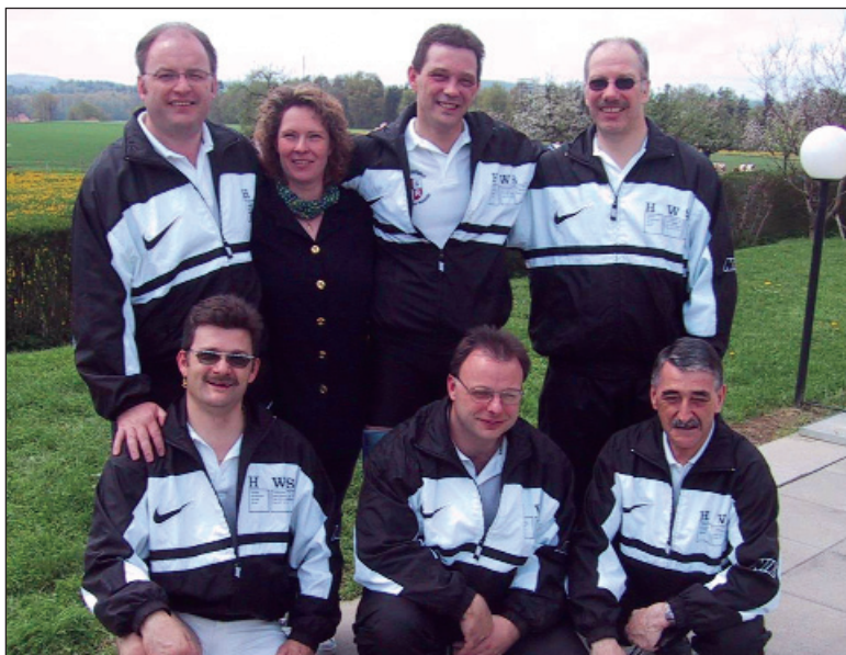
Schweizermeister Kantone-wettkampf 2004 Unterverband Basel-Stadt

Die Aargauer sowie Appenzell werden im 2005 die Aufsteiger der Kategorie C, Graubünden und Neuenburg, ersetzen. Überraschend in dieser Kategorie sicher die Waadtländer welche bereits zum zweiten Mal in Folge eine Auszeichnung erringen konnten.