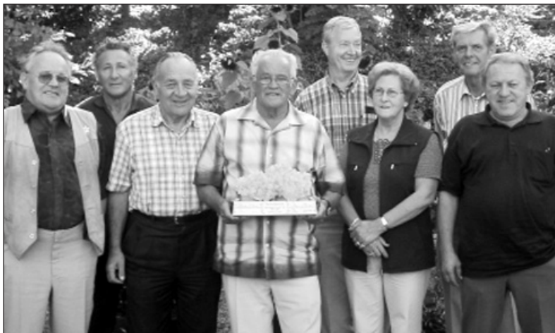
Wanderpreisgewinner nach acht Jahren; Seniorengruppe aus Zug.