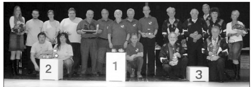
Kantonale Klubmeisterschaft Kat. A