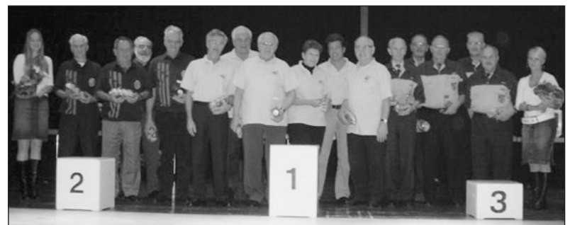
Kantonale Klubmeisterschaft Kat. C