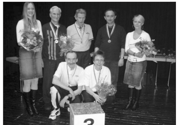
Kantonmeister 3. Rang