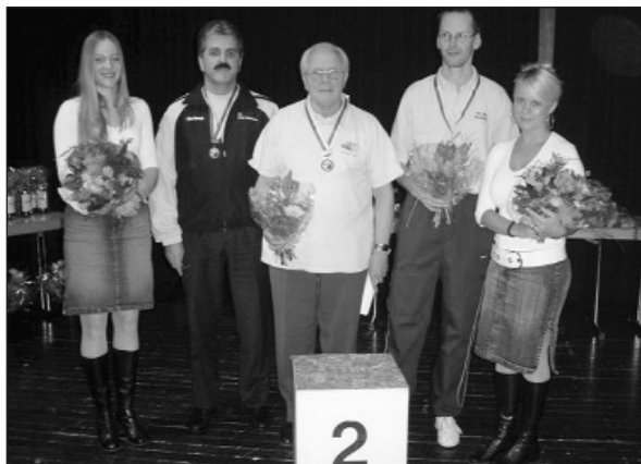
Kantonmeister 2. Rang