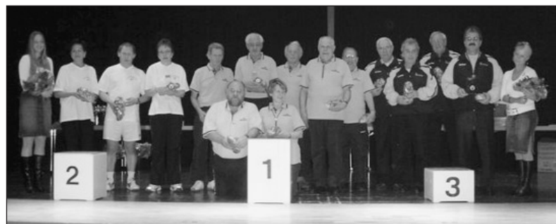
Kantonale Klubmeisterschaft Kat. B