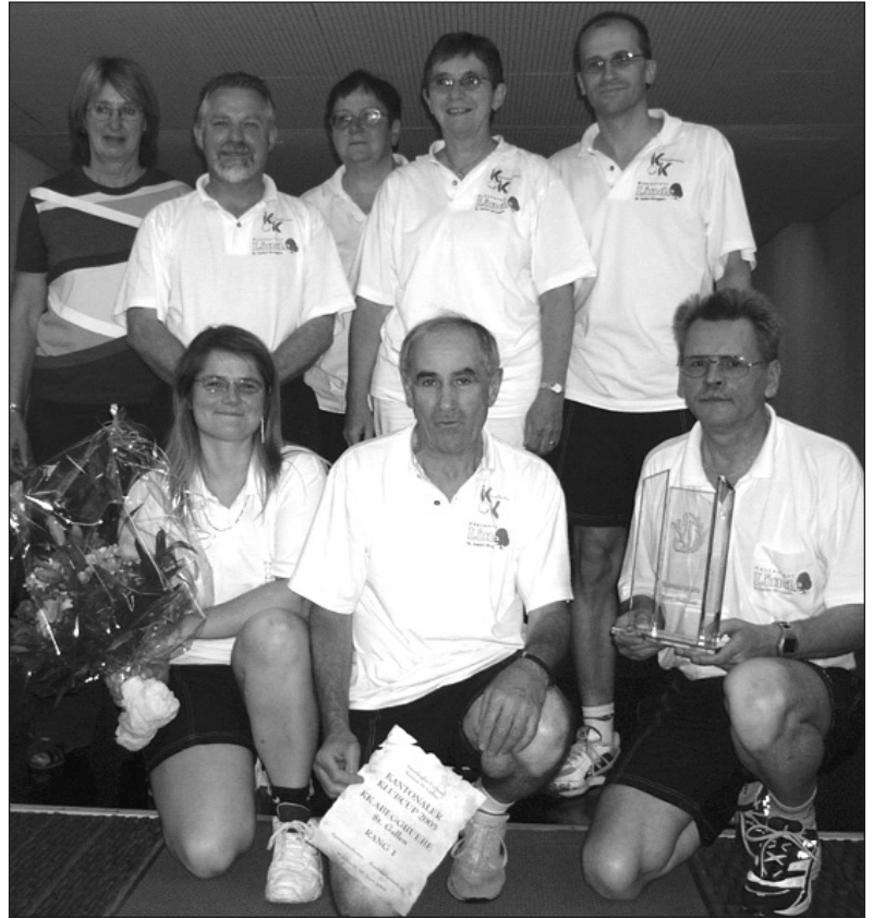
Die Kant. Klub-Cup-Sieger: KK Abeggbeuben