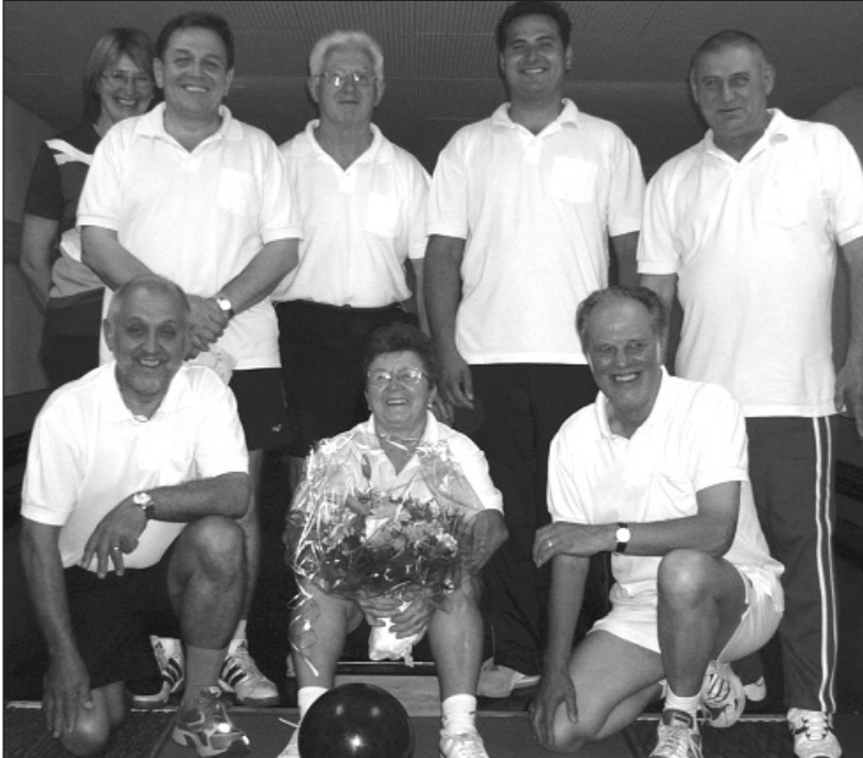
Die Zweitplatzierten: KK UZE