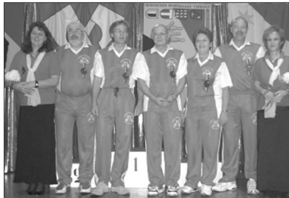
Rang 4: Sektion Thun-Oberland mit Total 8864 Holz, ergibt einen Durchschnitt von 1477.3 Holz