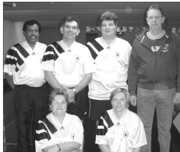
Dritte 5-Ständewettkampf 2005: UV Schaffhausen