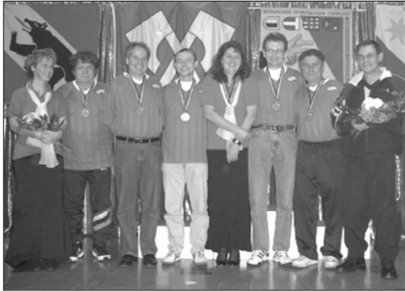
Rang 2: Sektion Biel-Seeland mit Total 9214 Holz, ergibt einen Durchschnitt von 1535.7 Holz