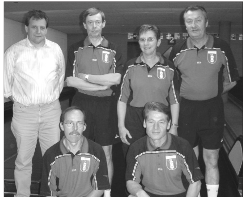
Sieger 5-Ständewettkampf 2005: UV St. Gallen

Für den UV Schaffhausen hat der dritte Rang dieses 5-Ständewettkampfs eine besondere Bedeu-