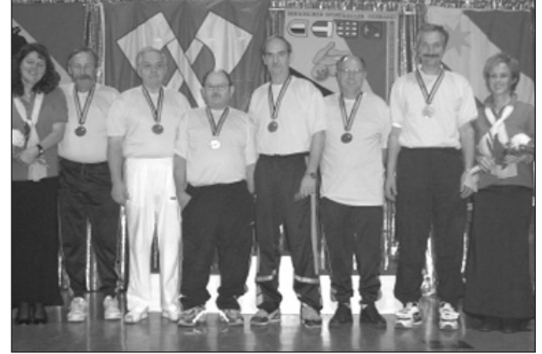
Rang 3: Sektion Emmental mit Total 9191 Holz, ergibt einen Durchschnitt von 1531.8 Holz