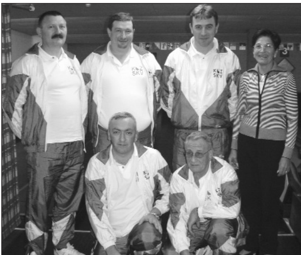
Zweite 5-Ständewettkampf 2005: UV Zürich