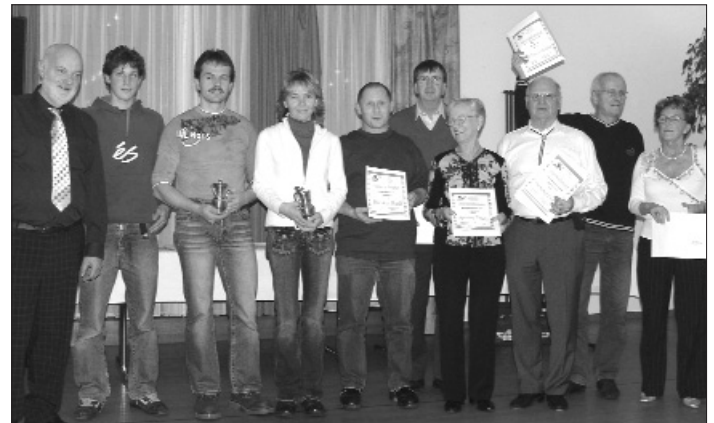
Die Wallisermeister 2006

Au nom du comité valaisan des Quilleurs-sportifs, je vous souhaite à tous un joyeux Noël et une heureuse année 2007.