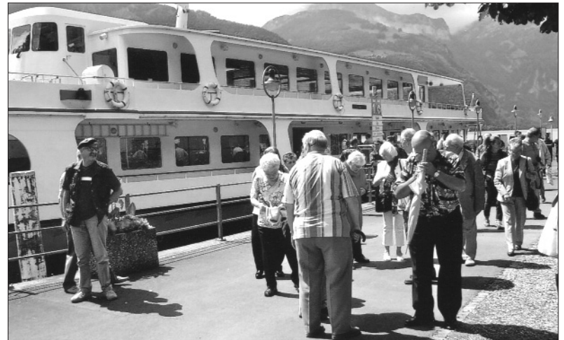
Die Seniorengruppe nach dem Verlassen des Schiffs.

In Luzern angelangt, wo wir eine Stunde Aufenthalt hatten, schien die Sonne. Das Schiff ist eingetroffen und wir konnten unsere Plätze einnehmen. Das Essen kam pünktlich. Wir hatten Zeit bis Flüelen und der Gedanken-Austausch war rege. In Flüelen besteigen wir bis Arth-Goldau unsere reservierten Plätze, von hier bis Zürich ebenfalls reserviert. Da in Zürich noch genügend Zeit war, konnten wir die S-Bahn benutzen.