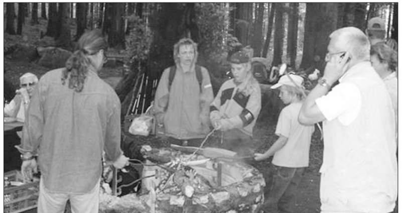
Das Feuer wurde rege benützt.

fortgeschrittenem Alter noch solche Ausflüge machen können, aber auch gleichzeitig bestaunten wir, wie jüngeren Frauen und Männer, wie sie behinderte Mitmenschen auf dem gleichen Rastplatz und vom gleichen Lagerfeuer aus bewirteten und versorgten. Solchen einsatzfreudigen Leuten sei auch einmal an dieser Stelle recht herzlich gedankt.