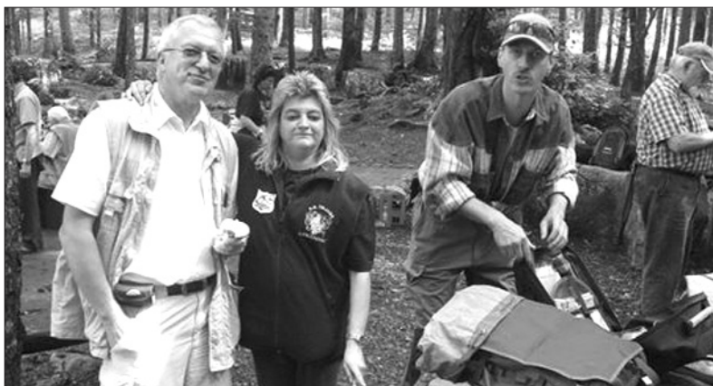
Die Lagerstimmung war hervorragend.

Sicher findet eine solche Unterverbandswanderung seine Fortsetzung, denn alle dankten den Organisatoren und sicher bleibt dieser Sonntag in bester Erinnerung.