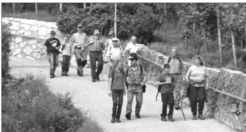
Der Rückmarsch führte durch die Weinberge.