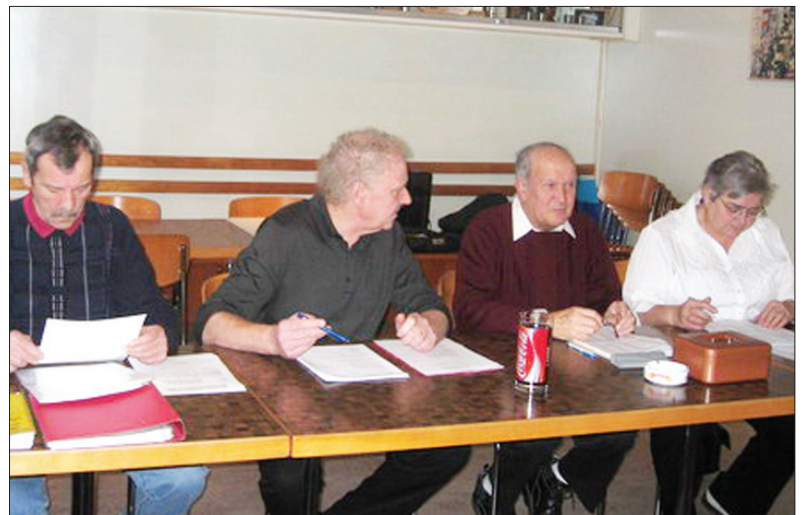
Der aktuelle Vorstand an der SSKV DV

Leider wird unsere Abteilung immer wieder von Todesfällen heimgesucht. So haben uns wiederum zwei Mitglieder Verlaufe des Jahres verlassen, was wir sehr bedauern.