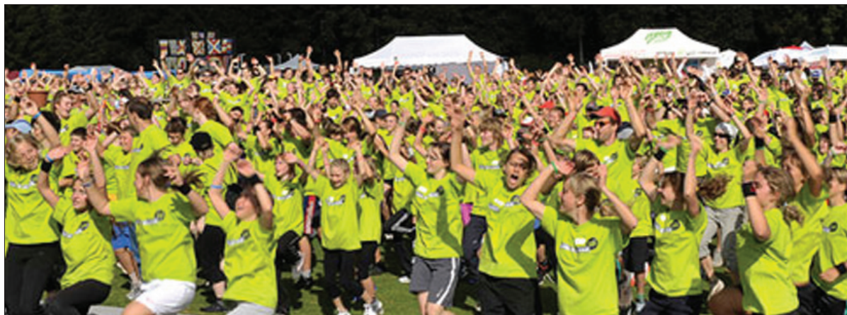
Die Teilnehmer an den diesjährigen «coll and clean»-Games.