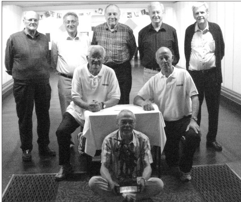
Die Siegermannschaft vom UV Zug.