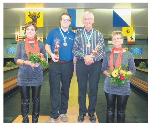
Medaillengewinner Kategorie A2.