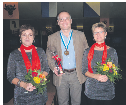
Medaillengewinner Kategorie A1.

Allen Mitwirkenden und Gästen an diesem Familienabend ein herzliches Dankeschön für diesen wunderschönen Abend und die vergnügten Stunden. Der Vorstand des LSKV freut sich jetzt schon auf eine interessante Sportsaison 2012 und auf einen ebenso unterhaltsamen und gemütlichen Familienabend 2012.