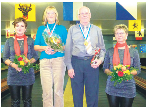
Medaillengewinner Kategorie B3.