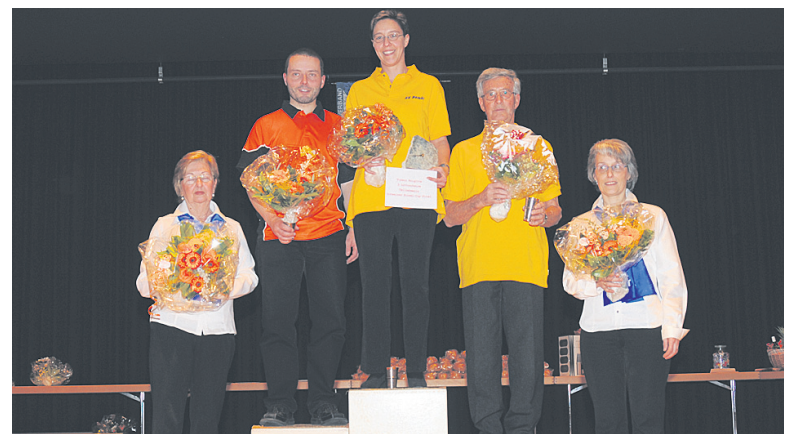
Die Cupsieger 2011.