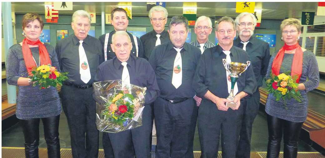
KK Specht: Rang 1 Kant. Klubturnier und Sieger Kant. Klubmatch Kat. A.