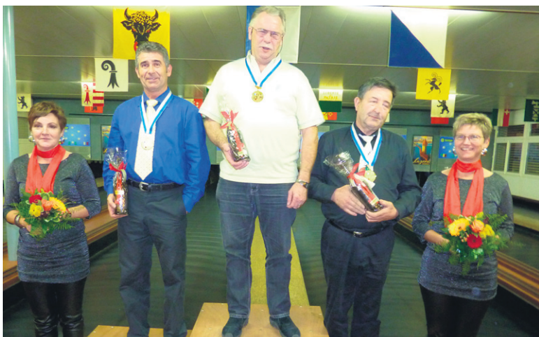
Medaillengewinner Kategorie B1.