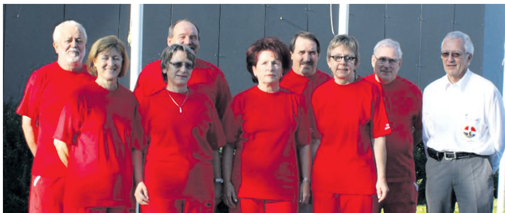
Die Nationalmannschaft 2011.