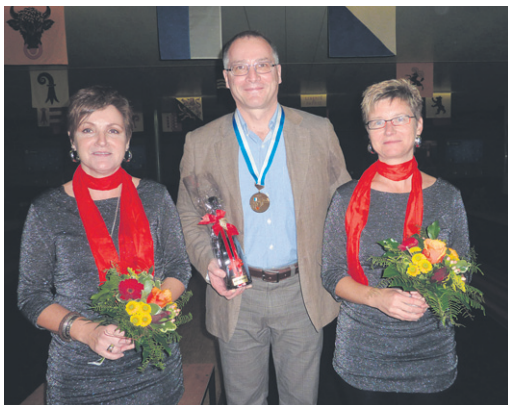
Medaillengewinner Kategorie AK.