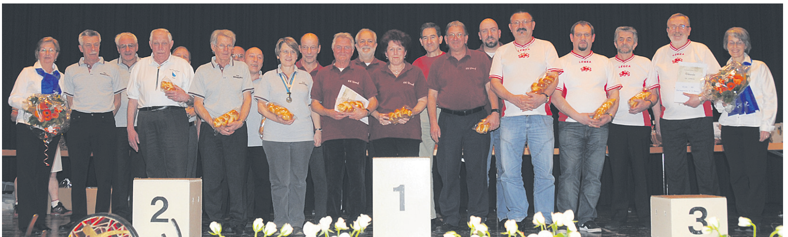
Die Sieger der Klubmeisterschaft der Kat. B.