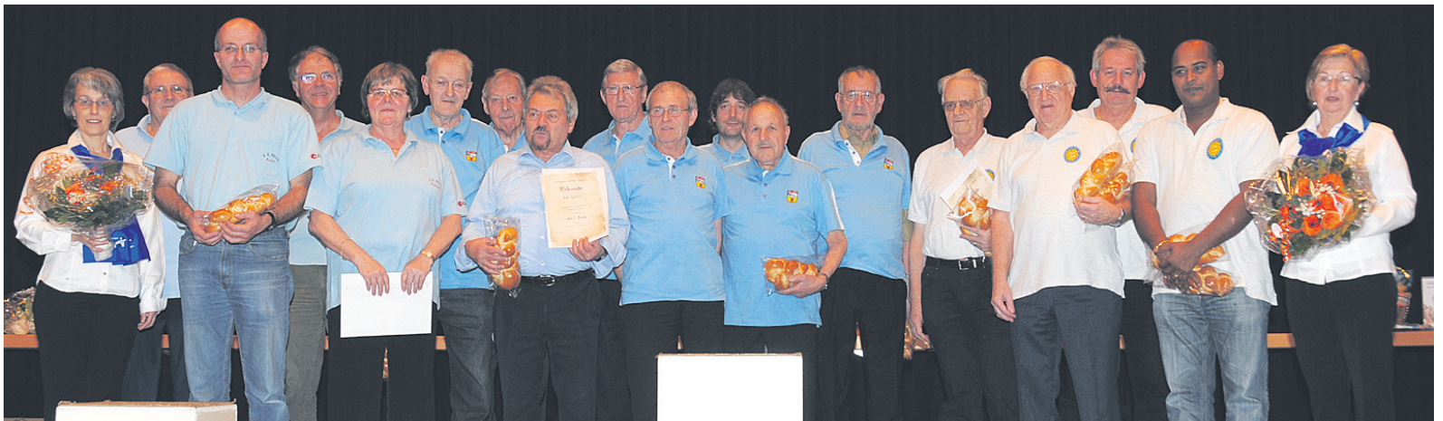
Die Sieger der Klubmeisterschaft der Kat. C.