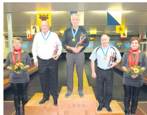
Medaillengewinner Kategorie A3.