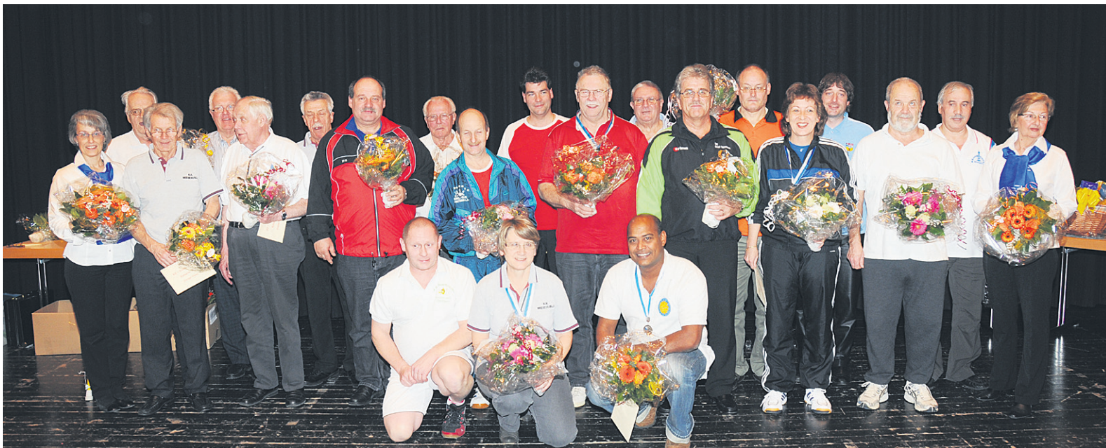
Die Erstplatzierten der Kantonalen Einzelmeisterschaft.