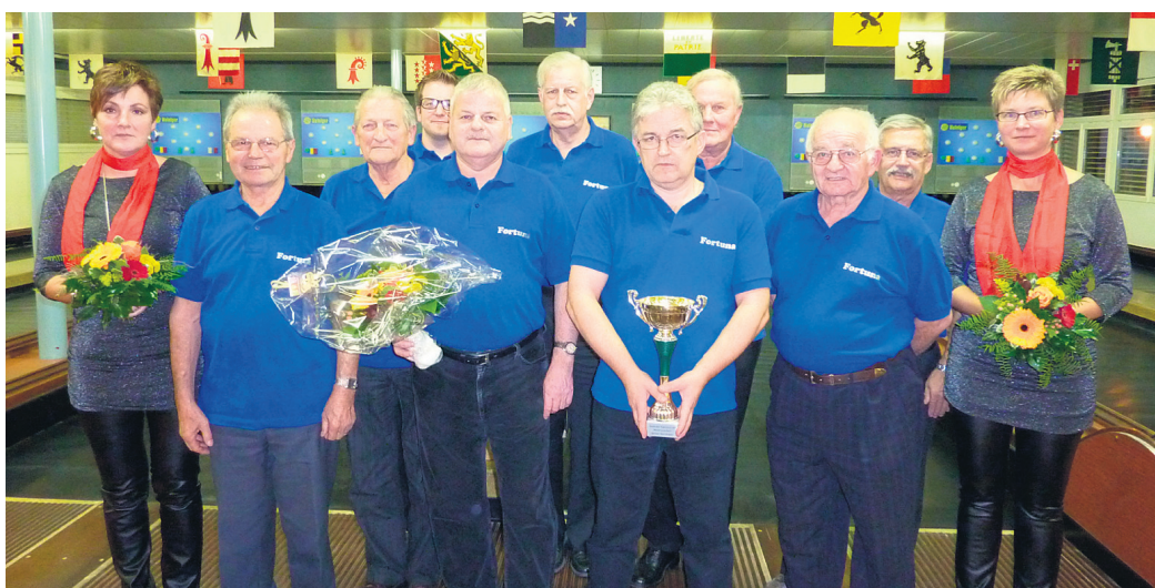
KK Fortuna: Rang 1 Kant. Klubturnier und Sieger Kant. Klubmatch Kat. B.