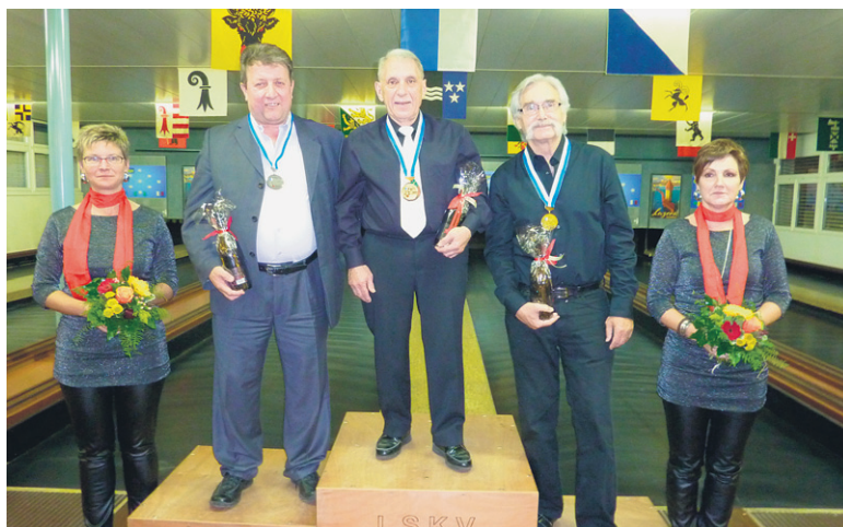
Medaillengewinner Kategorie B2.