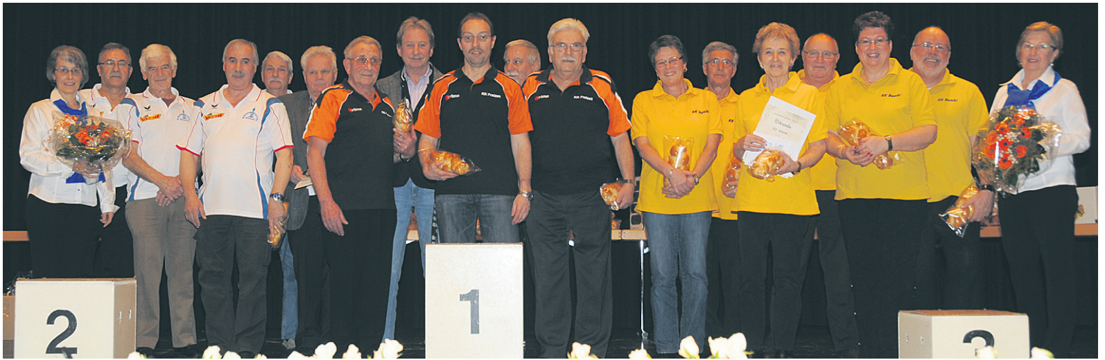
Die Sieger der Klubmeisterschaft der Kat. A.