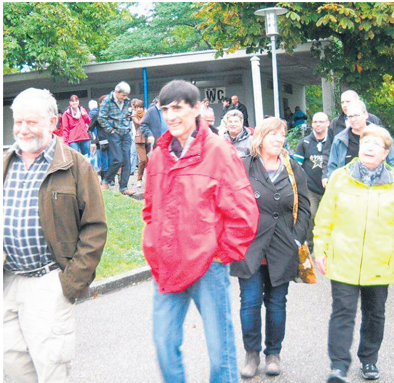
Nach dem Apéro gings zur Munotführung.

Wir durften nebst dem Wehrgang auch die renovierte Waffenkammer besichtigen und hörten von den beiden Guides einige herrliche