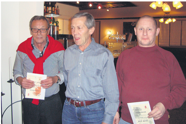
Die Erstklassierten der Jahresmeisterchaft Kat. A1.