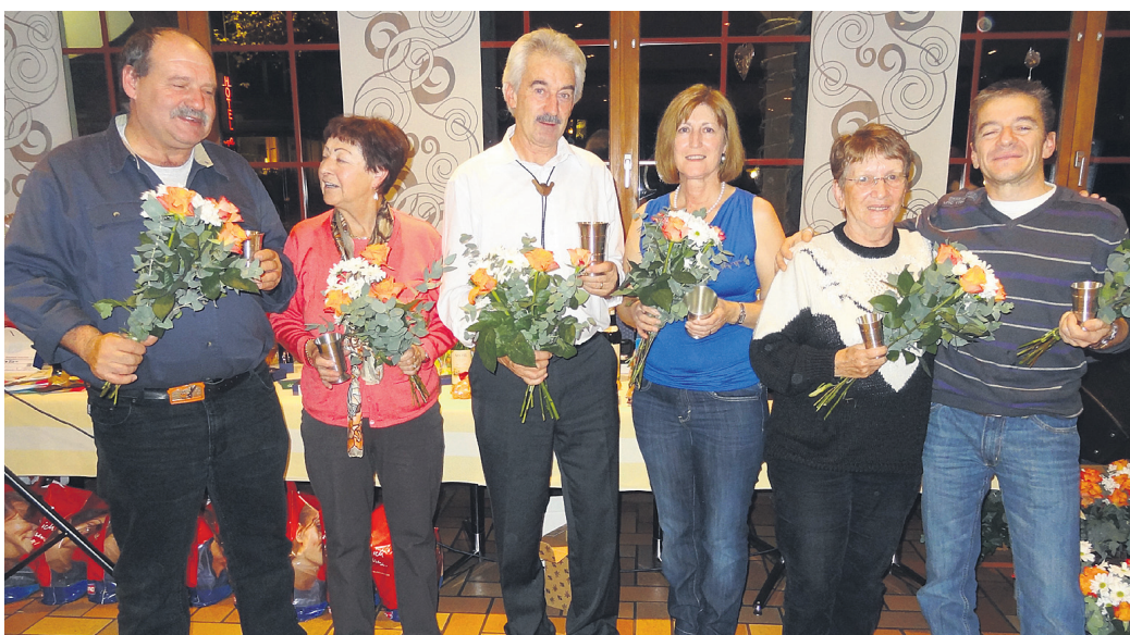
Die Verbandsmeisterinnen und Verbandsmeister 2012.