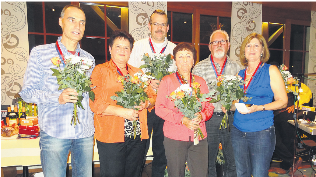
Die Landesmeisterinnen und Landesmeister 2012.

Darauf folgte Tanz und Geselligkeit bis Mitternacht. Es war ein schöner Abend.