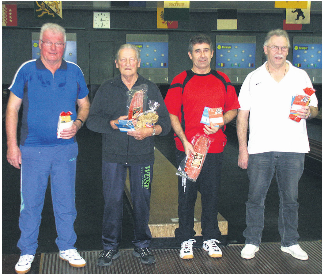
Die Luzerner Senioren und AK-Cup Sieger 2012.