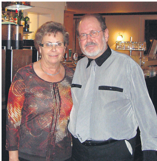
Die Sieger in der Jahresmeisterchaft der Kat. B2.