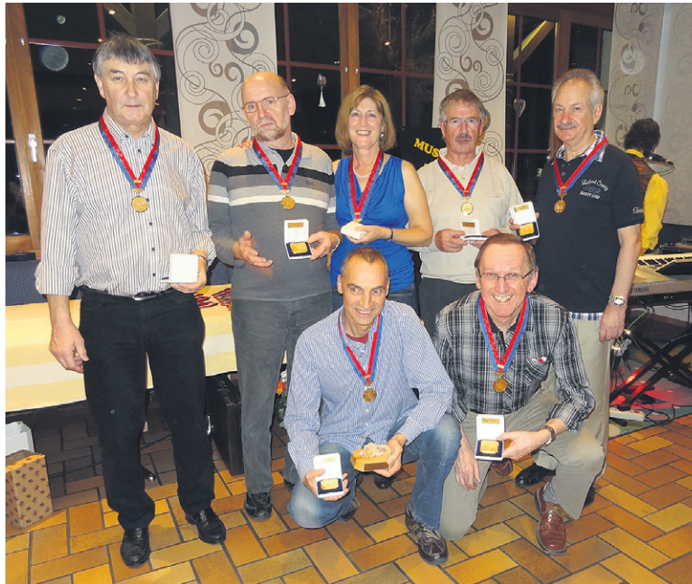
Die LSKV Klub-MS gewann der KK Fürstensteig.