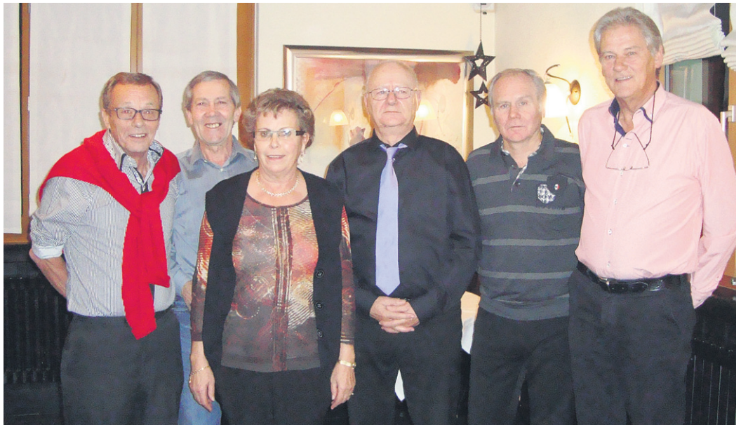
Die Erstklassierten im Walliser Weihnachtscup 2012.

Kat. A: 1. KK Aletsch, Naters, 2. KK Edelweiss, Ernen 3. KK Blonde 25, Naters usw.