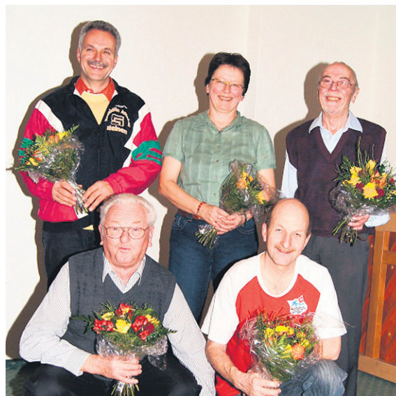
Die Drittplatzierten der Einzelmeisterschaft.