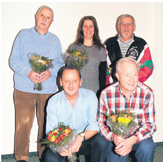
Die Zweitplatzierten der Einzelmeisterschaft.

Da das Jahr sonst in ruhigen Bahnen verlief und keine Anträge gestellt wurden, ging die GV zügig zu Ende und der gemütliche Teil konnte folgen. (Lotto spielen)