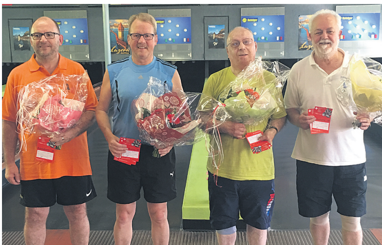
Die Finalisten der Kategorie Senioren.