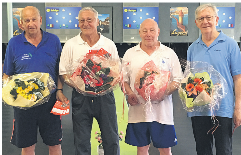
Die Finalisten der Kategorie AK