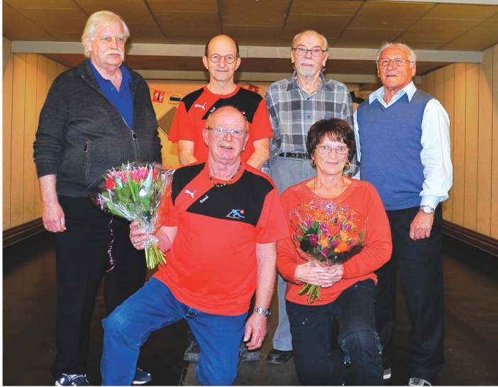
Die Erstplatzierten der Jahresmeisterschaft 2019.