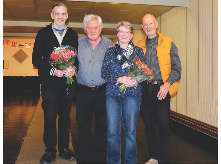
Die Zweitplatzierten der Jahresmeisterschaft 2019.