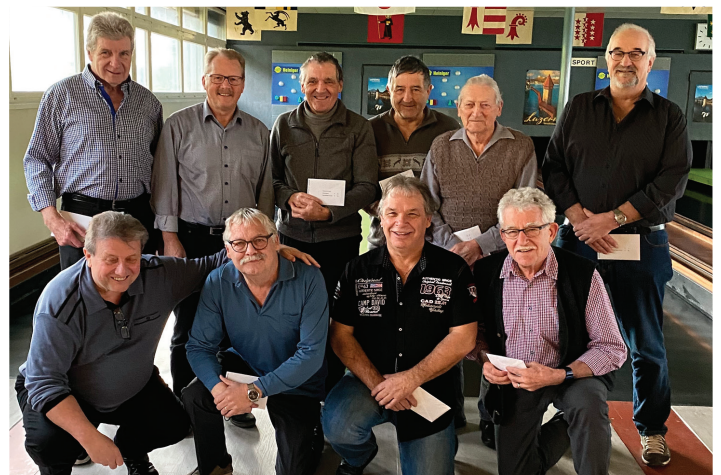
Die Sieger der verschiedenen Disziplinen.