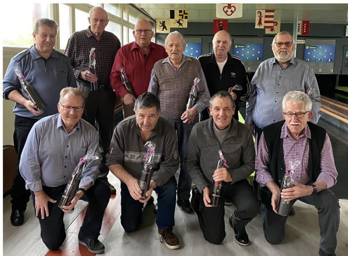
SSSKV Senioren und AK-Finalisten.