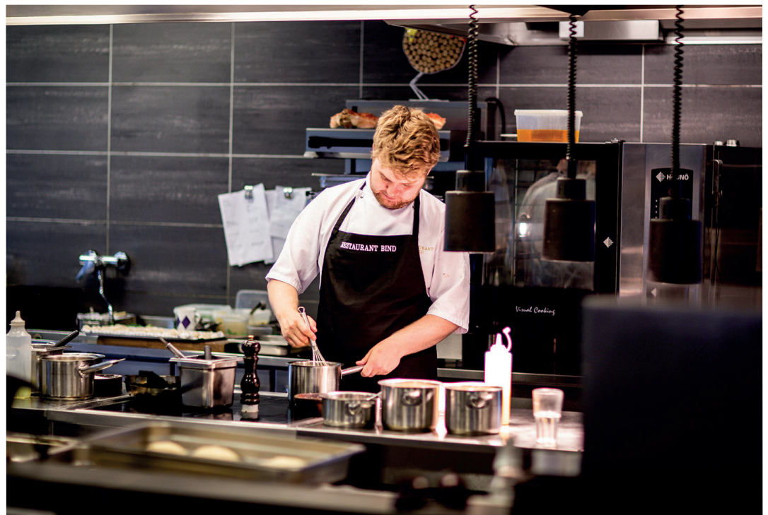
Der Bundesrat stellt die Öffnung der Restaurants in Aussicht.

Dies bedeutet auch, dass die Kegelhallen wieder zur Verfügung stehen. Auch wenn die wettkampfmässige Nutzung nur mit Maske möglich ist. Da scheiden sich nun die Geister. Die Sportkommission hat entschieden, dass die Kosten für die Wettkampfanzeigen nur für diejenigen Meisterschaften übernommen werden, die ohne Masken absolviert werden können. Also trotz Öffnung voraussichtlich anfangs Juni kann sich dies noch etwas herauszögern.