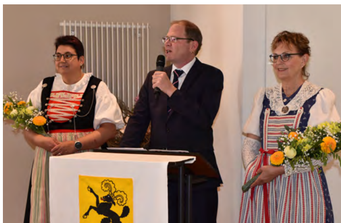
Begrüssung durch den Zentralpräsidenten

Vielen Dank dem Team vom Gasthof Ziegelhütten und allen Helfern, die zum guten Gelingen beigetragen haben. Herzlichen Dank auch unserer Fotografin Sonja Bühler für ihren tollen Einsatz. Hans Matzinger