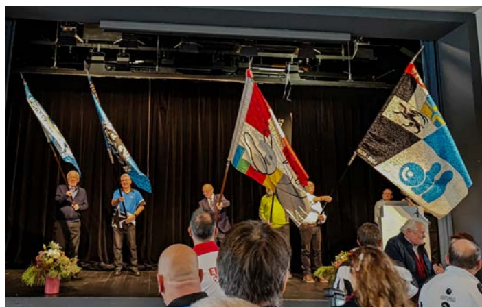
Die Fahnen werden feierlich auf der Bühne präsentiert.