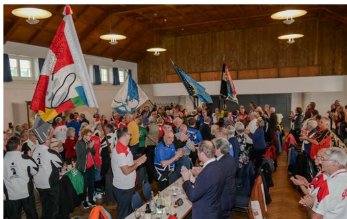
Einmarsch der Zentralfahne und der UV Fahnen von Zürich, Aargau, Graubünden und Fribourg.

Den zweiten Block startete Ivo Meier, der die diesjährigen Finalisten des Schweizerischen Einzelcupsiegerfinals auf der Bühne Ehren durfte. Im Anschluss wurde die Auslosung für den Einzelcup 2026 durchgeführt,