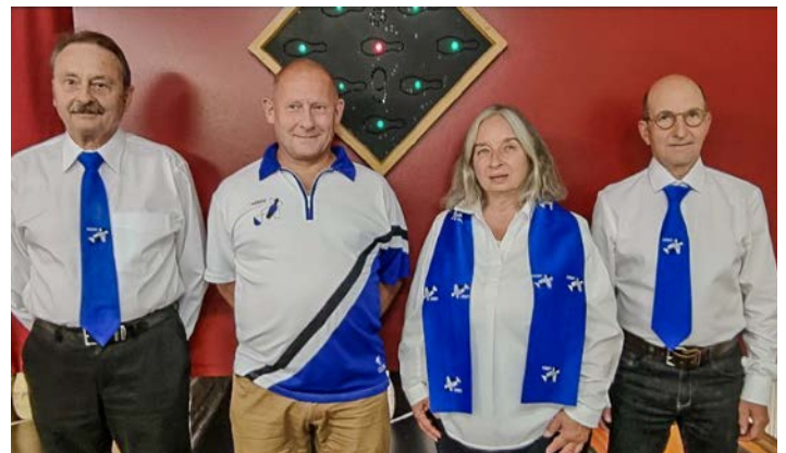
aktueller Vorstand 2026