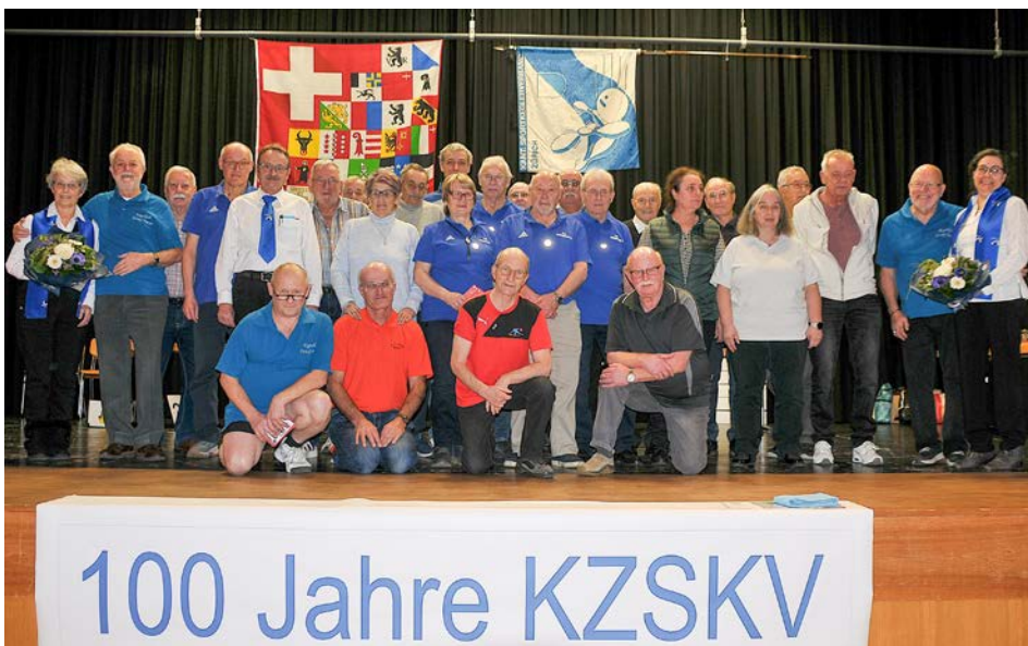
Alle Empfänger einer Fleisskarte

Bei den Wahlen meldete sich auch dieses Jahr niemand aus dem Saal für ein vakantes Amt in den Vorstand. Somit bleiben die Vizepräsidien unbesetzt.