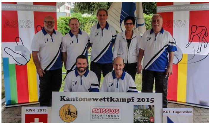
Sieg am Kantonewettkampf 2015